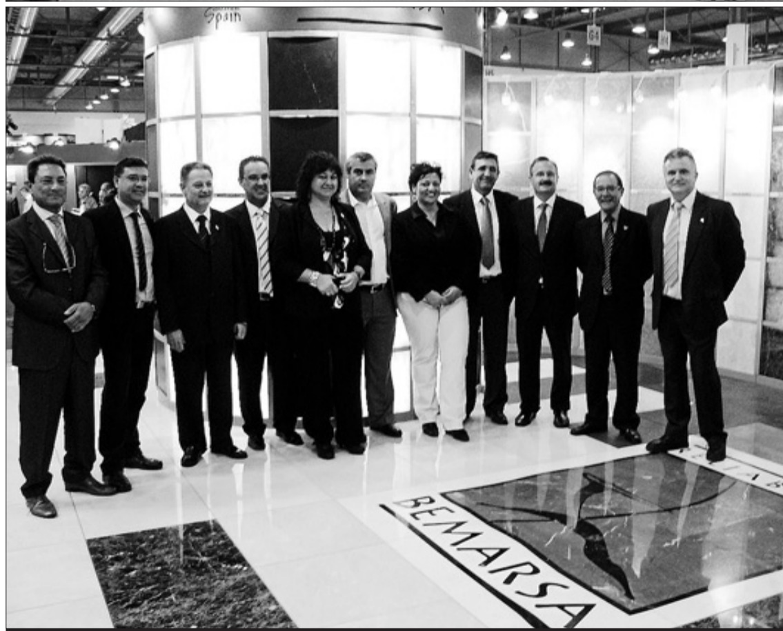
Arriba, los sindicalistas italianos a la entrada del pabellón español. Abajo, los alcaldes del Corredor con los empresarios

Marmomacc, cuando se decida si se han cumplido las expectativas con las que la expedición italiana viajaba a la cita más importante del sector.